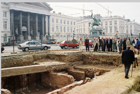
Visitors at an excavation in the heart of Brussels, with the remains of the old historic town underneath their feet.

Dans toutes les catégories, les femmes sont aussi bien représentées que les hommes, à l'exception du corps professoral des universités et de la catégorie des bénévoles. Il est évident que, dans les deux cas, les femmes privilégient plus aisément leur vie de famille. De la même manière, les emplois à temps partiel disponibles sont pratiquement tous occupés par des femmes. Les archéologues étrangers sont très rares et se retrouvent uniquement aux postes spécialisés dans les universités et les établissements scientifiques où ils exécutent un mandat. Aucune forme de discrimination n'a pu être déterminée à l'égard des personnes d'origine étrangère.