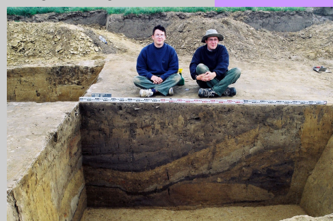
Quadrant of a wooden Roman cellar found in Wange (Flanders) with the students who made it sitting back from the section.

In alle categorieën zijn de vrouwen evengoed vertegenwoordigd als de mannen, met uitzondering van het professorenkorps aan de universiteiten en de categorie vrijwilligers. Het is duidelijk dat de vrouwen in beide gevallen gemakkelijker de voorkeur geven aan het gezinsleven en vooral aan de opvoeding van de kinderen. Ook de beschikbare deeltijdse jobs worden nagenoeg allemaal ingenomen door vrouwen. Buitenlandse archeologen zijn erg zeldzaam en komen enkel voor op gespecialiseerde posities en mandaten aan universiteiten en wetenschappelijke instellingen. Er kon geen enkele vorm van discriminatie worden vastgesteld ten opzichte van personen van allochtone afkomst.