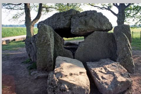
Wallonia has a rich archaeological history with well preserved remains from all periods, such as this megalithic tomb in Wéris.

On the basis of a survey which we conducted, we have established that the number of people who were engaged in archaeology in Belgium was 767 at the end of the year 2007. This is an approximation, of course. The categories which we documented included archaeological curators, field and project archaeologists and the academic staff of the universities, federal research institutions and museums. The survey also included people whose areas of research lay entirely or predominantly outside Belgium. In addition, specialised researchers who are involved in archaeological research but who do not have a degree in archaeology, such as biologists, botanist, geologists and historians were also represented. Technicians, administrative staff and the workmen who support the archaeologists in their work in Belgium were not included, nor were the volunteers who participate actively in archaeological surveys, excavations or in the processing of archaeological materials. Their number was estimated to be approximately 500-600.